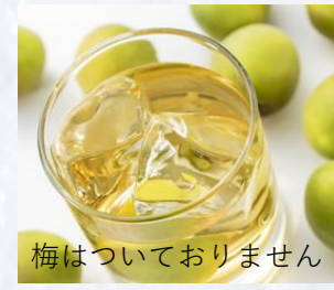
梅はついておりません