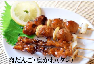
肉だんご・鳥かわ(タレ)