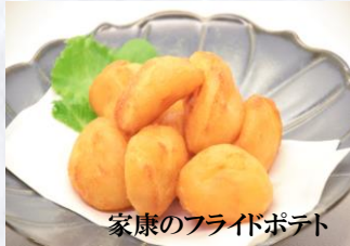
家康のフライドポテト